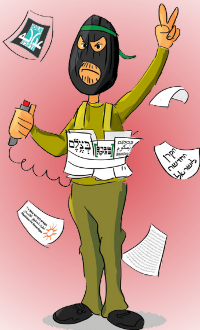
איור: יוחנן חאיק